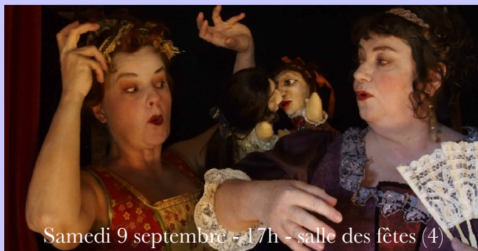
Samedi 9 septembre - 17h - salle des fêtes (4)

Une plongée clownesque dans l'univers baroque accessible à toutes les oreilles et à tous les âges.