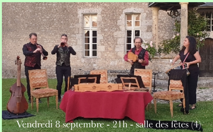
Vendredi 8 septembre - 21h - salle des fêtes (4)

La figure féminine dans la musique de la Renaissance.