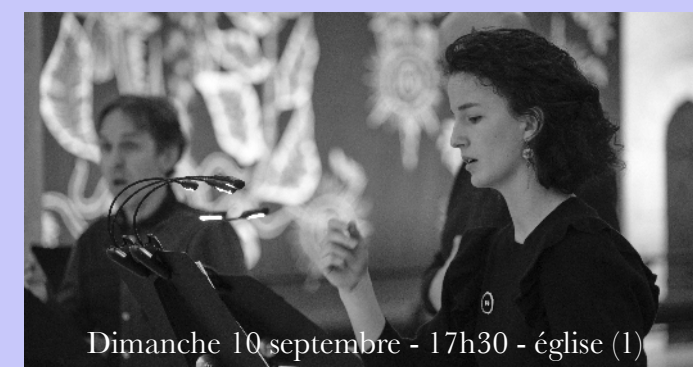
Dimanche 10 septembre - 17h30 - église (1)

La longue vie du célèbre peintre Titien (1490-1576), à une époque charnière de la Renaissance le désigne comme témoin privilégié de son époque, et reflet de l'évolution musicale en Italie tout au long du XVI e siècle. Portraitiste préféré de Charles-Quint, François 1 er , Soliman le Magnifique, du pape Paul III, ami intime de l'Arétin dont il fréquentait assidûment le palais, il entretient des rapports d'amitié avec les hommes et femmes les plus puissants et les plus savants de son temps. A Venise, il fréquente les milieux artistiques où musiciens, peintres et écrivains se rencontrent.