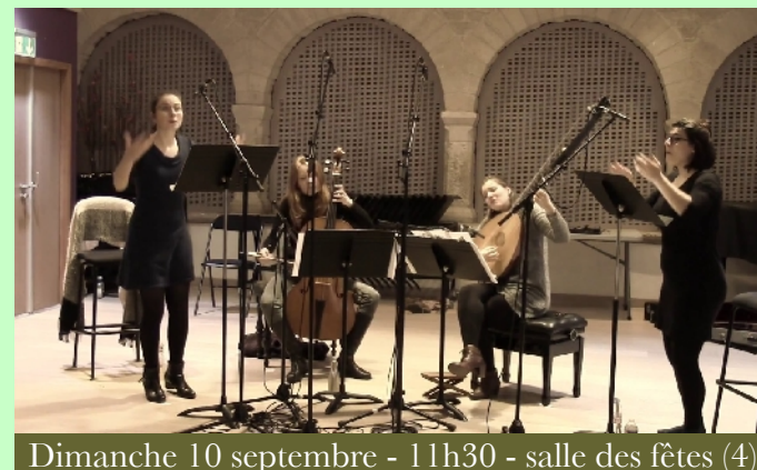
Dimanche 10 septembre - 11h30 - salle des fêtes (4)

Les brunettes sont une forme de chanson populaire de l'époque Baroque que l'on se fredonnait au creux de l'oreille près du bassin d'Apollon ou entre les bosquets du Petit Trianon du château de Versailles. Fruit d'un travail passionné principalement orienté sur l'exploration des répertoires pré-baroques et baroques, l'ensemble des Kapsber'girls, formé en 2015, réunit quatre musiciennes qui cherchent une nouvelle clé de lecture quant à l'interprétation des sources historiques. Puisant leur inspiration dans divers répertoires à caractère traditionnel, elles jettent un regard transversal sur les oeuvres des XVII e et XVIII e siècles et s'amuse avec les genres.