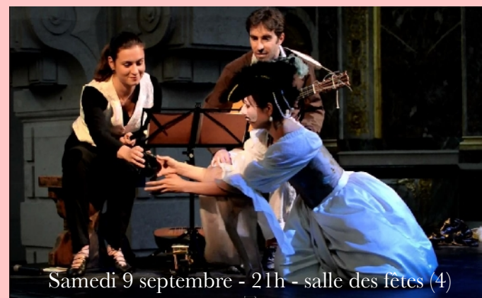
Samedi 9 septembre - 21h - salle des fêtes (4)

La Royale est construit sur la succession de trois portraits d'une femme au temps de Louis XIV. Exprimés par la danse, portés par la flûte et le théorbe, ces trois portraits la dépeignent à trois périodes de la vie. Par l'entrelacement d'une correspondance épistolaire - égrenant la vie amoureuse d'une jeune femme - et de musiques de Robert de Visée, La Royale nous fait entrer dans la sphère intime, si prisée au 17 e siècle. En écho à la Princesse de Clèves, ou aux Lettres de Madame de Sévigné, ce spectacle conjugue la délicatesse et l'expression des passions amoureuses. Le naturel et la grâce brossent le portrait en clair-obscur d'une femme du grand siècle.