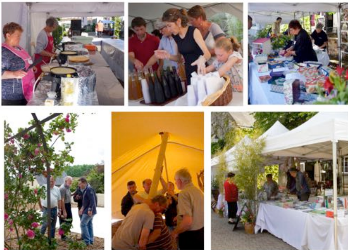
Buvette et restauration au cœur du village dans la vigne du curé